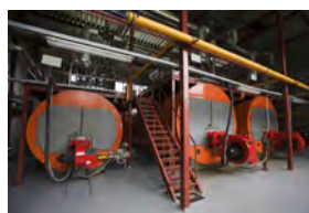
Котлы & Технологическое тепло