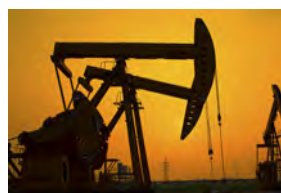
Нефть & Газ, Геотермальное тепло