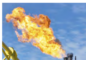
Исключение факельного горения