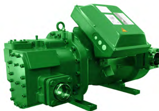
BITZER ПОЛУГЕРМЕТИЧНЫЙ ДЕТАНДЕР/ГЕНЕРАТОР